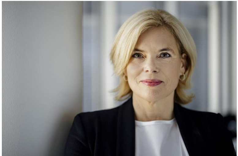
Präsidentin des Deutschen Bundestages, Julia Klöckner (CDU), © Deutscher Bundestag

Als Pauline Herber im Jahre 1885 den Verein katholischer deutscher Lehrerinnen gründete, spielten die Themen Mädchenbildung oder Frauenrechte eine untergeordnete Rolle in Deutschland. Der VkdL hatte es sich von Anbeginn zur Aufgabe gemacht, über gezielte standespolitische Initiativen nicht nur konkrete Verbesserungen für Lehrerinnen anzustoßen, sondern auch den Ausbau des Mädchenschulwesens voranzutreiben. Die Gründung des VkdL erwies sich als wegweisend und segensreich: Die erfolgreiche Emanzipationsgeschichte in Deutschland lässt sich auch auf die Vorbild-